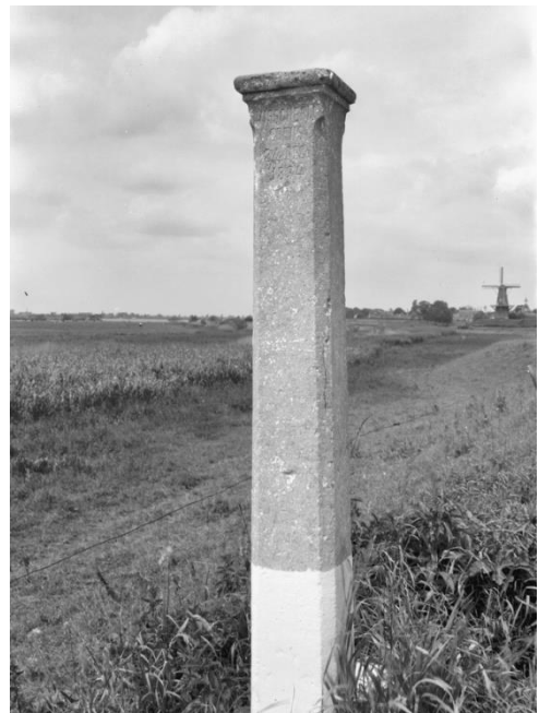
Rijksdienst voor het Cultureel Erfgoed 1964