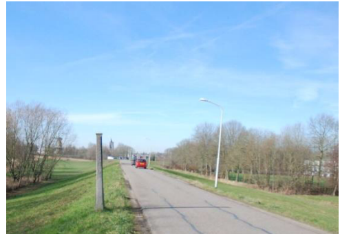
Graaf Reinald Alliantie

Er is gekozen voort binnenwaartse versterking. De opgave is dat de kruinhoogte van de nieuwe dijk 80 cm hoger wordt dan de bestaande kruin. De kruin en het buitentalud van de dijk ter hoogte van het monument worden opgehoogd met klei, afgedekt met een laag teelaarde (buitentalud) of wegfundatie (kruin). Daartoe wordt eerst de bestaande laag teelaarde van het buitentalud verwijderd.