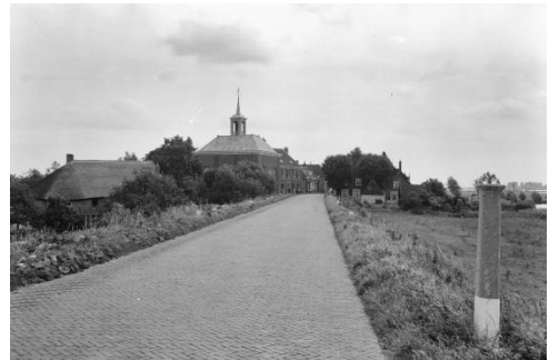
Rijksdienst voor het Cultureel Erfgoed 1964